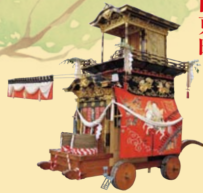
◎大幕 旧幕（嘉永二年作）中国の故事より張良が、師・黄石公の香を拾い捧げ、兵法の書を授かることを表現 ◎彫刻（天保六年作）早瀬長太郎（名古屋）