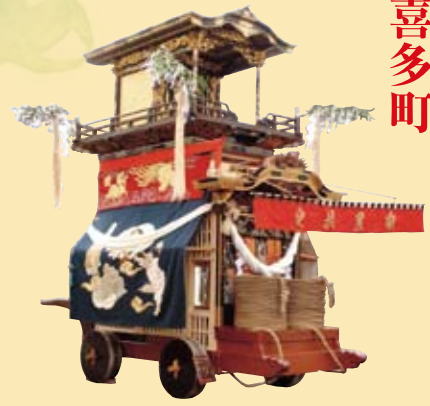
◎大幕（昭和五十年作）七福神を表現（旧幕は無地・天保二年制作） ◎彫刻（明治十四年作）瀬川重光（名古屋）