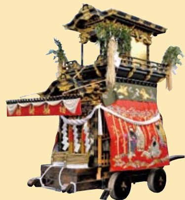
◎大幕 旧幕（明治二八年作）支那竹林の七賢人を表現 ◎彫刻 作者不詳