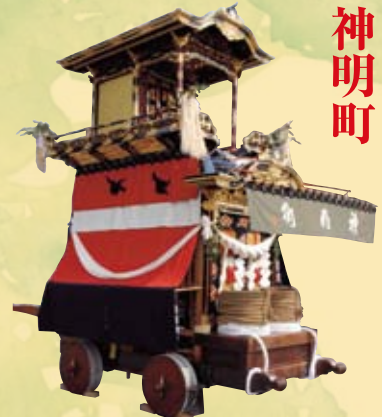
◎大幕 旧幕（天保二年作）祭神の不和童子の姿を白・赤・青の三段幕で表現 ◎彫刻（明治四十四年作）瀬川鍋三郎（名古屋）