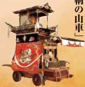
今年の華車・田南町

挙母祭りでは年ごとに、八輦の先頭に立つ山車を入れ替わり、神社境内に最初に曳き込まれる車を華車と呼ぶようになりました。