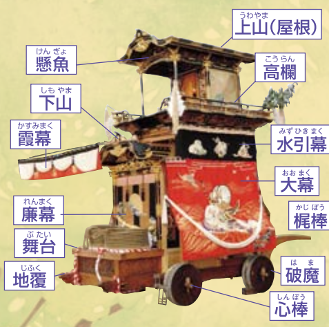
◎大幕 旧幕（嘉永二年作）源平の戦いにおける熊谷直実と平敦盛の姿を表現 ◎彫刻（安政二年作）瀬川重光（名古屋）

令和四年の華車である優美さが誇りの山車の祖形は宝暦2年（1752年）に造られ、安永5年（1776年）大改修された。