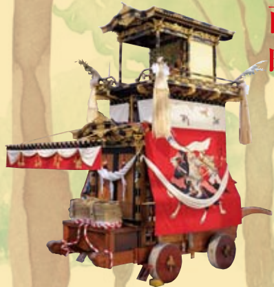
◎大幕 旧幕（大正十五年作）湊川の戦いにおける楠木正成と、如意輪堂の楠木正行を表現 ◎彫刻（明治三九年作）伊藤松次郎則光（名古屋）

挙母祭り 挙母神社の例祭として寛永年間（1624～1643）の頃から、五穀豊穡を祈り行われていました。最古の記録としては、寛文四年（1664年）飾奉四輜（東町・本町・中町・神明町）、獅子舞（南町）後に傘鉾（西町・竹生町）とあり、寛延三年（1750年）には挙母藩の命により、従来の獅子舞を廃止し山奉を建造し始め安永六年（1777年）に南町・西町が翌年には北町（現・喜多町）・竹生町の飾り車ができ八輜となりました。この八輜の山車は、昭和三十九年（1964年）に愛知県の有形民俗文化財に指定されるとともに、豊田市の指定文化財にもなっています。掛け声と紙吹雪の中を山車が駆ける勇壮なさまは、三河の三大祭りに数えられ多くの人に親しまれております。