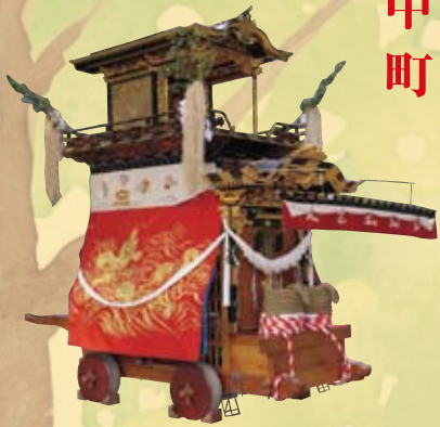
◎大幕 旧幕（天保六年作）神社東に「蛇の池」があったことから、波に竜を表現 ◎彫刻（大正十四年作）初代 村山群鳳（高山）