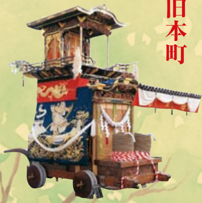
◎大幕 旧幕（明治三年作）源義経の八艘跳びと平教経の雄姿で、壇ノ浦の合戦を表現 ◎彫刻（文政二年作）二代 立川和四郎富昌（諏訪）